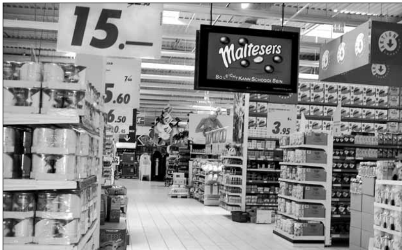
Interior d'una gran superfície de la cadena Carrefour

Mentre l'any 1995, el 35,5% de les compres d'alimentació es feien als supermercats, el 2006, la proporció pujava al 45,5%. A l'altra cara de la moneda, la quota de mercat del comerç tradicional va baixar del 35,6% al 28,8% en aquest mateix període. Les xifres i l'evidència quotidiana mostren que s'està produint un procés de substitució del model de comercialització: de l'establiment petit de propietat familiar al model de gran cadena de distribució i comercialització que, com a tal, requereix una inversió potent. Al mateix temps que, al conjunt de l'Estat, el nombre de locals comercials destinats a la venda al detall d'aliments i begudes augmentava un 8% entre 2001 i 2005, el nombre d'empreses dedicades a aquesta activitat va descendir un 6%.