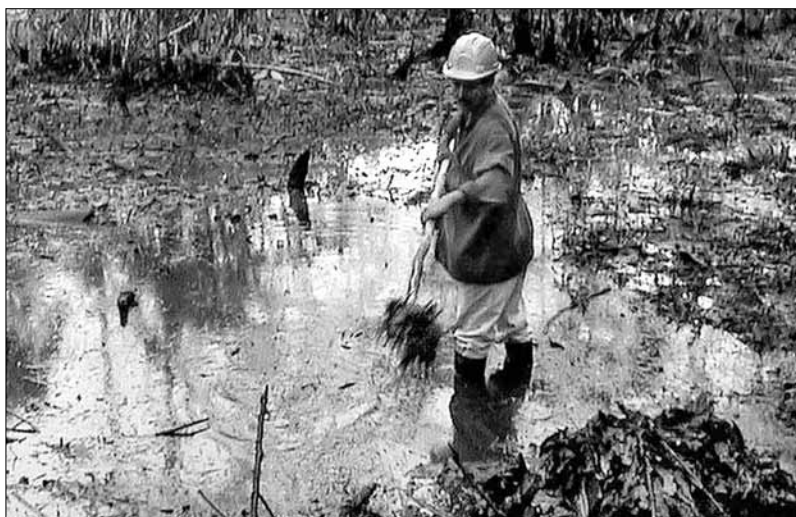
Camp contaminat dins la Reserva de Yasuní, a l'Ecuador.

El model agroindustrial vigent, dependent del petroli tant en energia com en entrades, és fill d'aquest sistema i, com a tal, no s'escapa de produir aquests efectes. Podem trobar components de deute ecològic en tot el seu cicle de producció, distribució i consum, com ara les emissions de gasos que augmenten l'efecte hivernacle, la biopirateria, la generació de passius ambientals per part de les empreses transnacionals i l'exportació de residus.